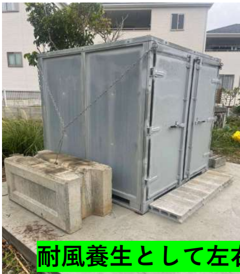
耐風養生として左右にトングブロックを設置