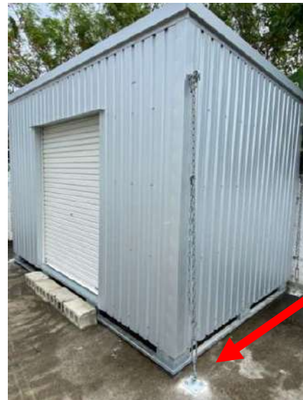
スペースの都合で トングブロックが 置けない場合は アンカー工事も 対応可の場合も。

個人宅や、ヤード内へ手軽に設置可能なので 使い勝手いろいろ！ 耐久性があるので農具、機材、物置として活用 できる