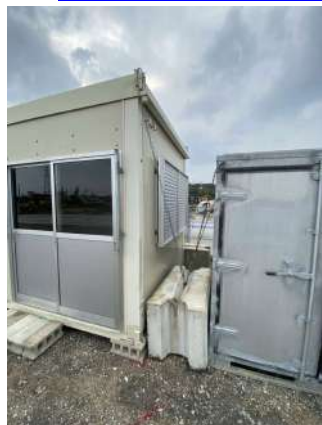
ハウスと倉庫を片側1個の トングブロックで固定したケース