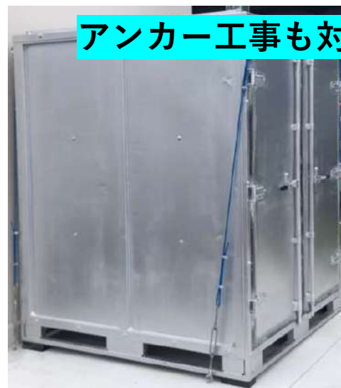
アンカー工事も対応できる場合あり