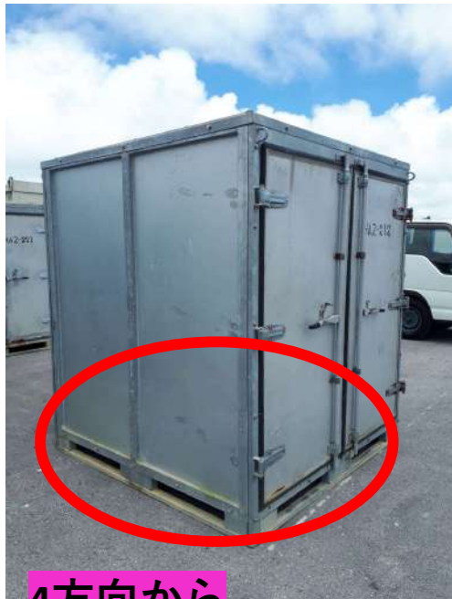
4方向から フォーク作業可